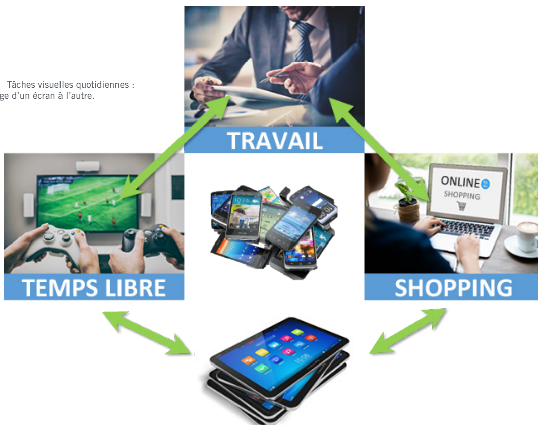
FIG. 1 | Tâches visuelles quotidiennes : passage d'un écran à l'autre.

Le système de vision binoculaire peut être incapable de se maintenir correctement dans des tâches continues en vision de près. Un ANSBD peut témoigner de cette affection, mais même les patients présentant des capacités binoculaires limitées, normales ou appropriées sont confrontés à ce problème. Cela peut nuire à l'apprentissage et aux tâches cognitives des enfants et des adultes, et avoir un impact négatif à l'école et au travail. 23, 24 (Figure 1)